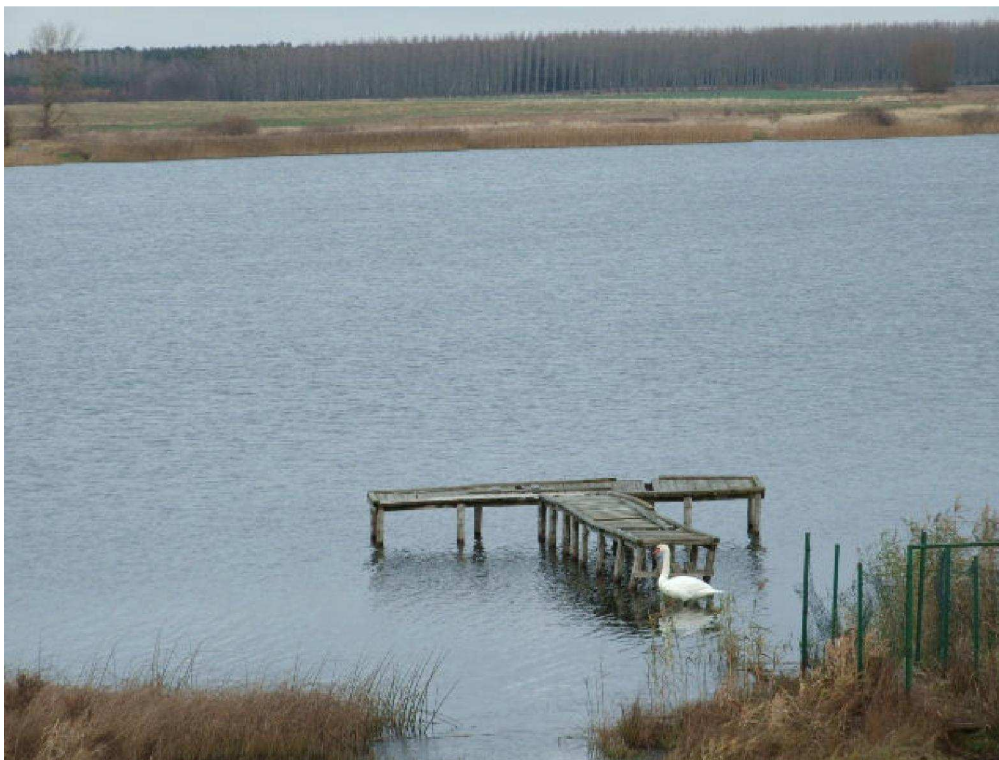
zdjęcie nr 6 *

Staraniem gminy tereny przyległe do jezior są przekwalifikowane na działki rekreacyjne, a następnie zagospodarowywane - pod domki letniskowe, plaże, pola namiotowe, parkingi. W ślad za rozwojem turystycznym tych miejscowości są zamiary tworzenia gospodarstw agroturystycznych zapewniających dodatkową bazę noclegową i różne atrakcje. Wędkarze mogą liczyć na złowienie sumy, sandacza, węgorza, karpia, leszcza.