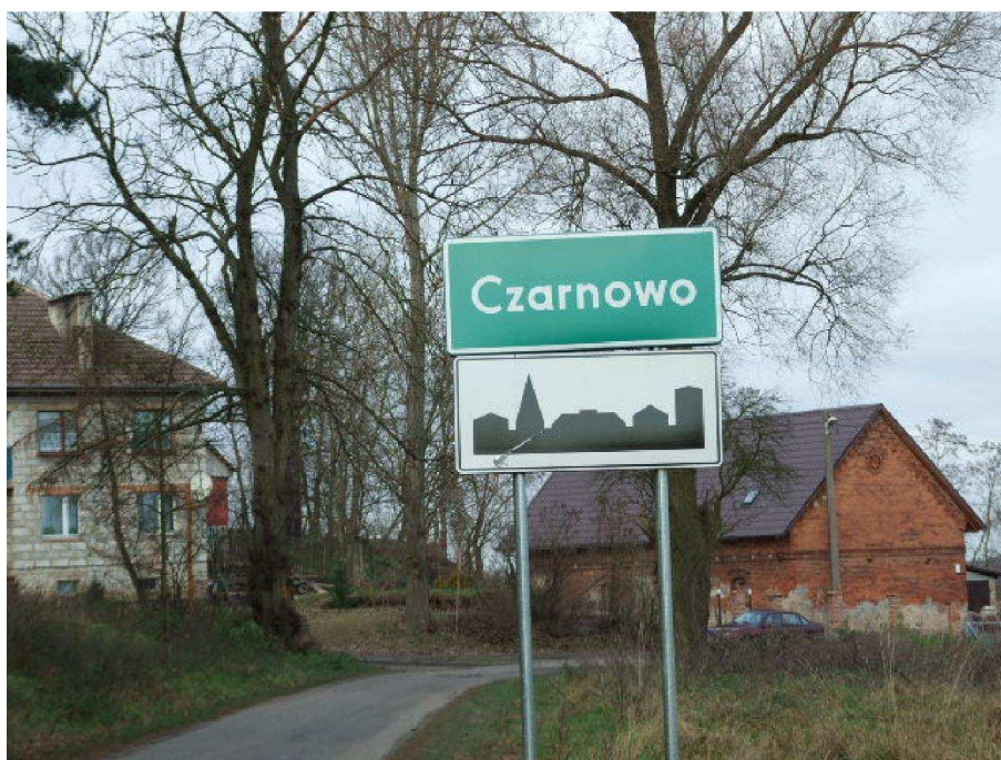
zdjęcie nr 1