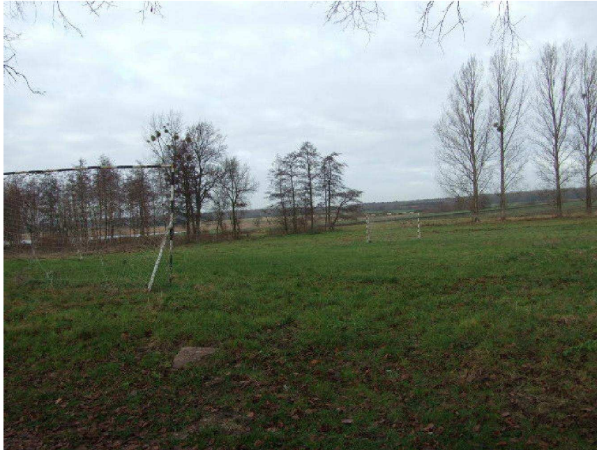
zdjęcie nr 8*

Dokładny przebieg i koszt prac budowlanych znany będzie po otrzymaniu pełnej i gotowej dokumentacji technicznej i kosztorysowej. Planowany koszt realizacji inwestycji to kwota 300 tys. zł. Harmonogram realizacji inwestycji to lata 2008 - 2012. Poniżej przedstawiony został plan inwestycyjny: