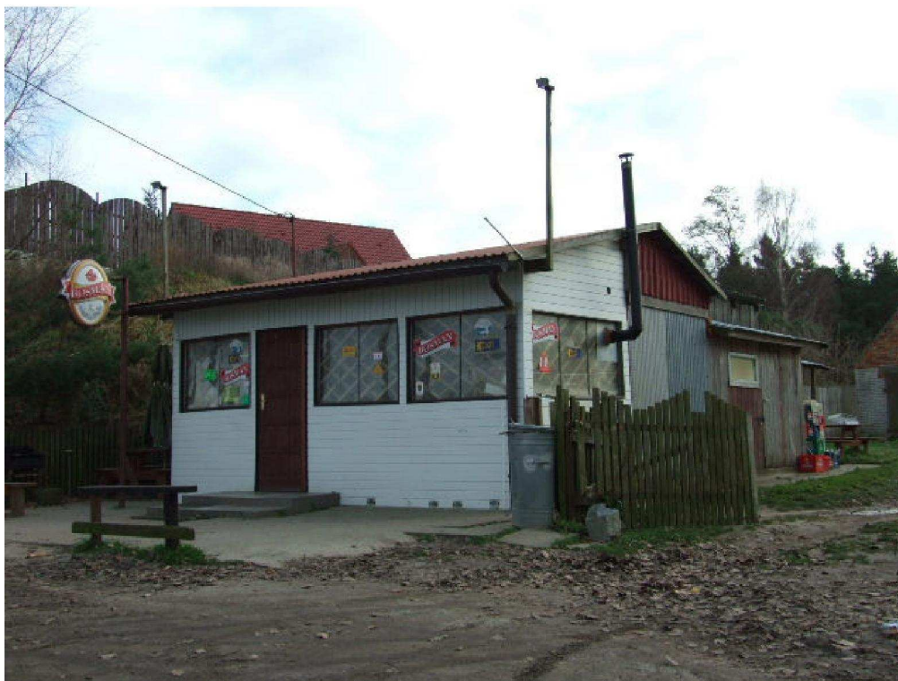
zdjęcie nr 4 *