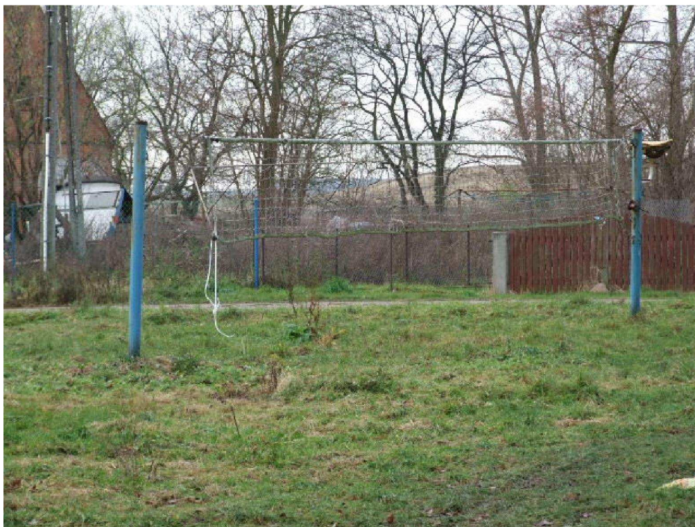
zdjęcie nr 5 *

Na terenie gminy ponadto istnieje i prężnie działa Gminny Ludowy Uczniowski Klub Sportowy „SKRZAT”. Dyscypliną wiodącą, dzięki której klub jest w pierwszej trójce klubów województwa zachodniopomorskiego, jest tenis stołowy.