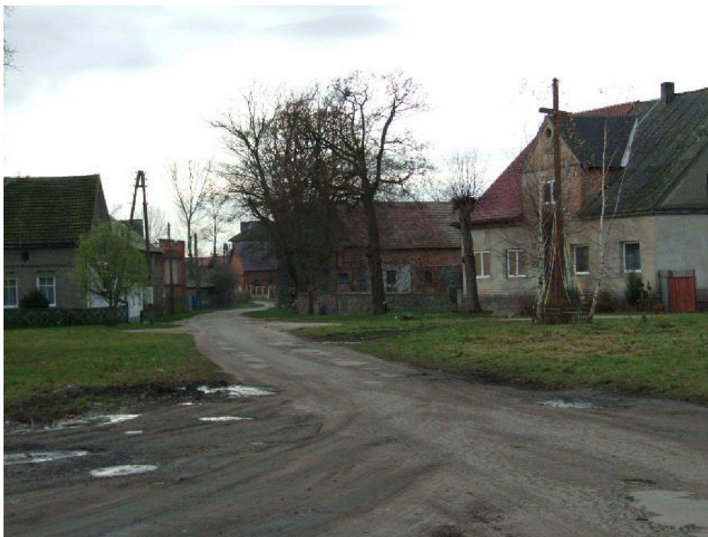
zdjęcie nr 7*