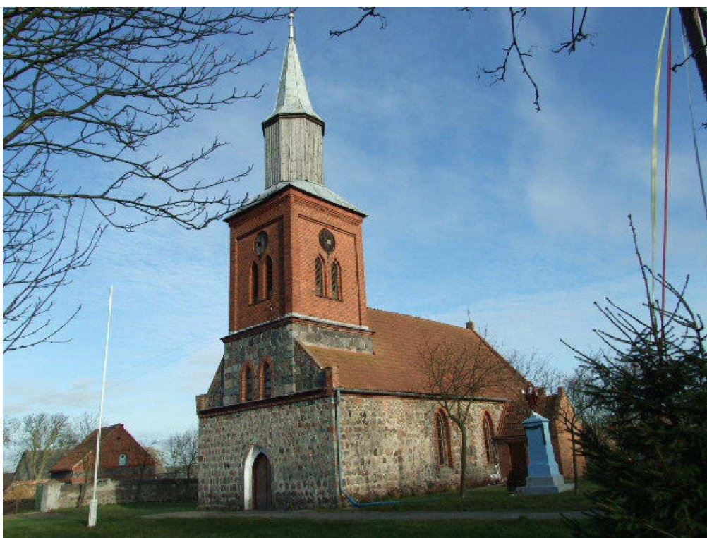
zdjęcie nr 3*

Jedynie z dużym prawdopodobieństwem można przypuszczać, że wieś Załęże była pierwotnie osadą typu placowego, najprawdopodobniej okolicową. Do wsi prowadził pierwotnie jeden dojazd, najprawdopodobniej od południowego lub północnego zachodu. Osada nie miała charakteru przejezdnego. Zabudowa miała charakter zwarty, a zagrody (nie więcej niż kilka) rozmieszczone wokół niewielkiego placu, na którym posadowiony był kościół. W okresie pomiędzy końcem XIX w. a latami 20 - tymi XX w. obraz przestrzenny osady nie uległ zmianie. Centralna, placowa część osady podzielona jest krótkimi uliczkami na pięć nieregularnych części. Od trójkątnego, wielodzielnego nawsia w kierunkach południowym, południowo - zachodnim i północno - zachodnim odchodzą drogi, przy których dwustronnie rozmieszczona jest zabudowa.