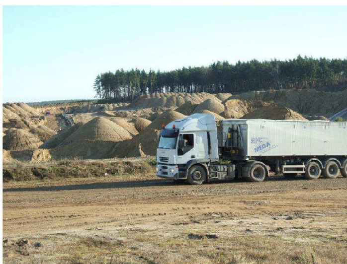
zdjęcia nr 4*, 5*, 6*, 7*

Ponadto na terenie miejscowości istnieje 5 zarejestrowanych podmiotów gospodarczych, które prowadzą własną działalność gospodarczą, są to w większości podmioty jednoosobowe.