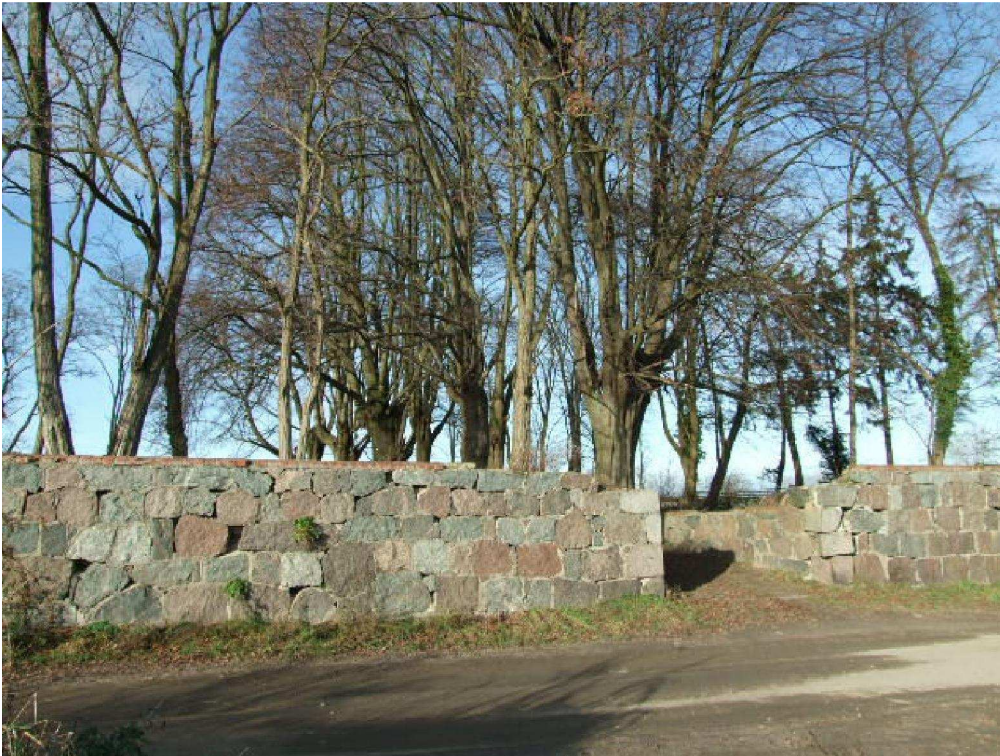
zdjęcie nr 10*

Mur stanowiący umocnienie skarpy okalającej cmentarz: