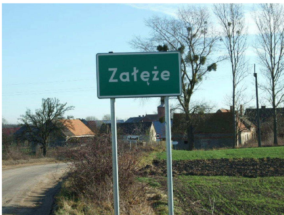
zdjęcie nr 1